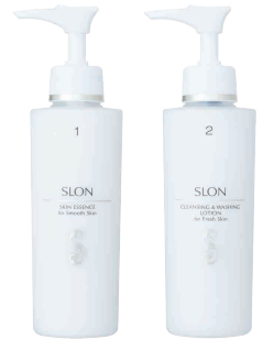
左: スロン スキンエッセンス 145ml ¥3,672 右: スロン クレンジング& ウォッシングローション 145ml ¥3,348

「スロン ペア洗顔」は、お肌の潤いや保湿成分を守りながら、角質コンディションを高め、ふんわり柔らかく洗い上げます。