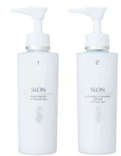
左: スキンエッセンス 右: クレンジング&ウォッシングローション